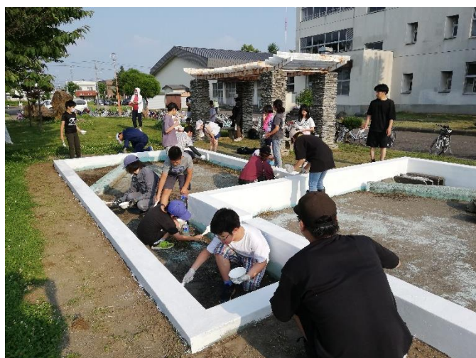
古かった池を花壇に改装