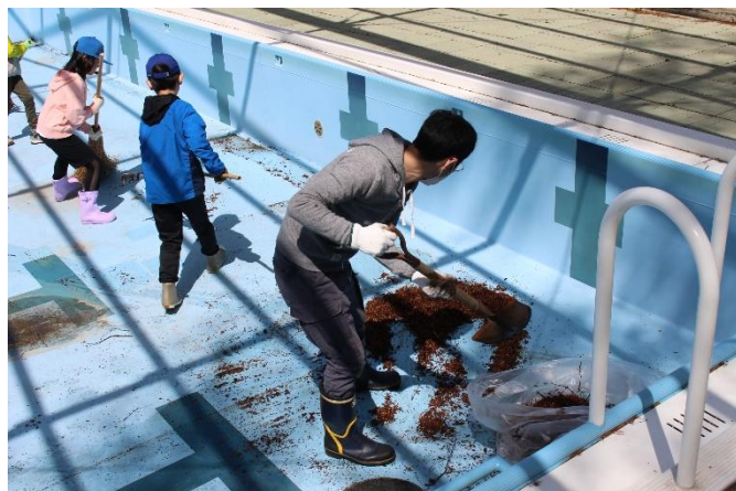
気持ちよくプールを使うために