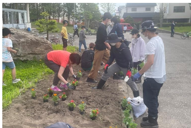
玄関前の花壇の整備