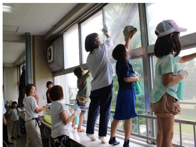
ガラスを拭いて教室を明るく