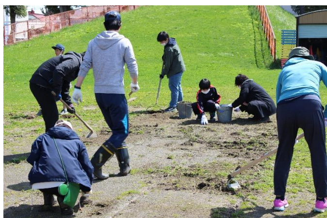
運動会前のグラウンド整備