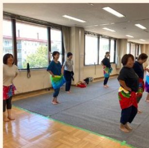
難しい動きに苦戦