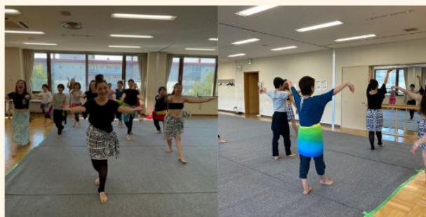
笑顔溢れるダンスタイム!