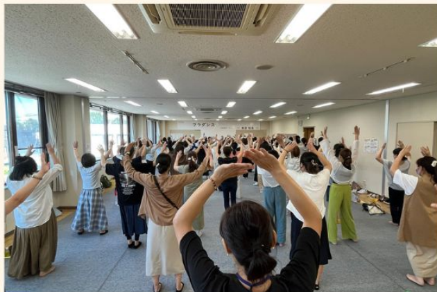
最初は恥ずかしかった人も 体を動かすうちに楽しくなってきました