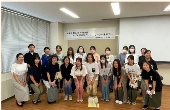
とってもためになるお話ばかりで 即実践できるような内容でした!