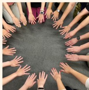
最後に全員の 爪先集合!