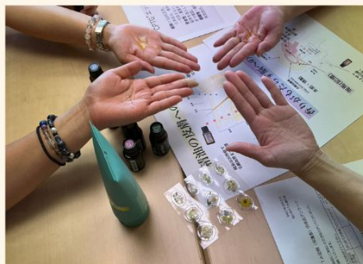
アロマの香りと効能で とにかく癒される・・・