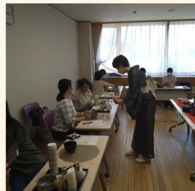
テーマの通り 気軽に楽しめて 皆さん大満足でした!