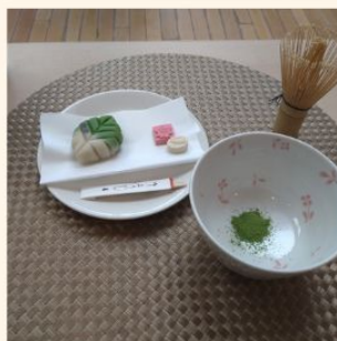
とても美味しい 壺屋の和菓子とともに