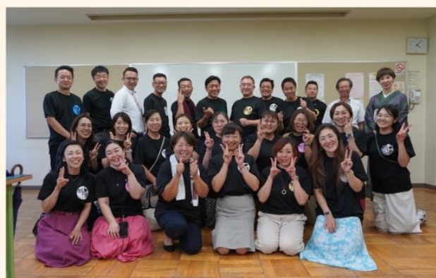
4年ぶりの開会式ありの開催となりましたが たくさんの保護者に参加いただき 楽しんで頂くことができました!