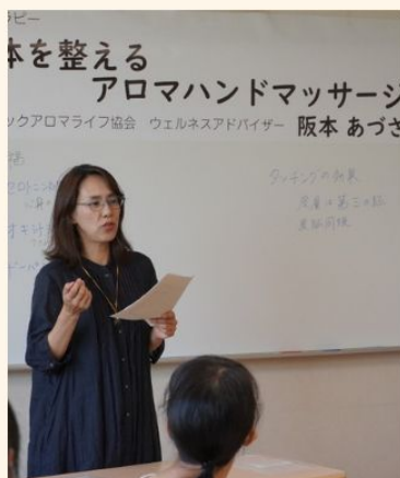
香りとの関係性など 心との関係にも関わること に気づきました