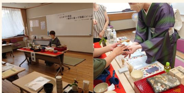
日本の良い部分を感じられる空間