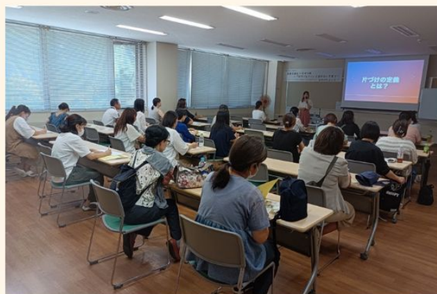
子どもと一緒に片付けを楽しめるよう どう声かけていけば良いかも学びました