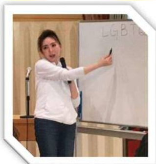
咲楽屋 紗滄 りょう 様 講師2名様